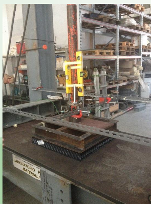
Esecuzione test di compressione.

GRM viene essere fornito in pannelli pre-assemblati mediante collante a base di solvente, che non lascia alcun residuo sul prodotto finito.